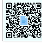
各種申込フォーム